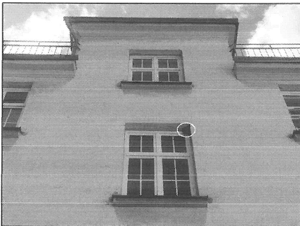
Obr. 2: Nepoškozené hnízdo jiříčky obecné (elipsa) v okenním výklenku na severní straně domu